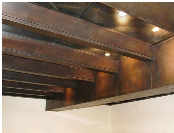
A lépcső fő karakterét a sötétbarna szín és az antik hatás adja, mely a réz speciális polírozásának köszönhető.

A 2011 decemberében kezdeményezett átalakítás során 45 tonna réz és a réznek, cinkkel alkotott ötvözetét (sárgarézt, melyet arany színéről ismerünk) használták fel. A sárgarézt lemezek formájában építették be, melyeket antikoltak majd felpolíroztak. Így alakították ki a nyugati lépcsőt, mely a második emeleten található nyolc, külföldi festők műveinek szentelt szobához, összesen 480m 2 alapterületű kiállítótérhez vezet.