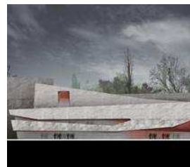
SALA KONCERTOWA NA JORDANKACH W TORUNIU