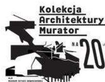
TACY BYLIŚMY - 25 LAT INNOWACJI